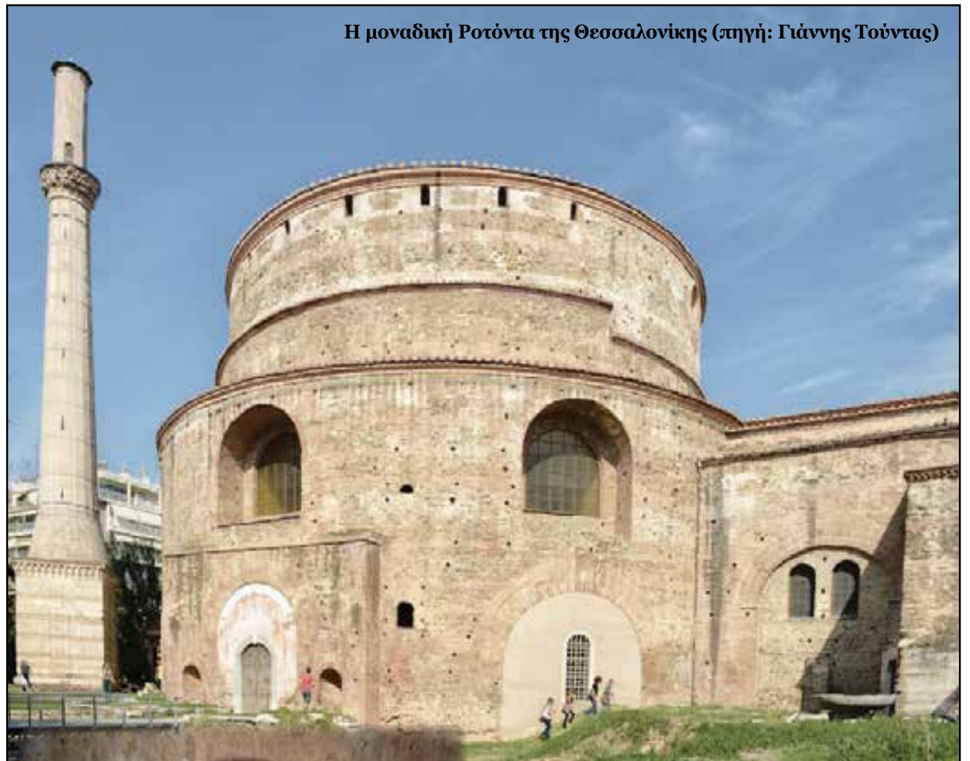
Η μοναδική Ροτόντα της Θεσσαλονίκης

Κατά τα έτη 1590-1591 μετατράπηκε σε τζαμί (έφερε την ονομασία Χορτατζή Σουλεϊμάν Εφέντη τζαμί).