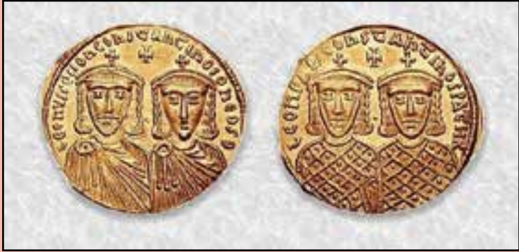
Ο Λέων Δ' μαζί με τον Κωνσταντίνο ΣΤ' σε νόμισμα της εποχής

Αυτοκράτορας του Βυζαντίου (775 – 780). Ανήκε στη δυναστεία των Ισαύρων. Ο Λέων γεννήθηκε στις 25 Ιανουαρίου 750 στην Κωνσταντινούπολη και ήταν γιος του βυζαντινού αυτοκράτορα Κωνσταντίνου Ε' του Κοπρώνυμου και της πριγκίπισσας των Χαζάρων Τζίτζακ (Ανθή στα ελληνικά), η οποία είχε βαπτιστεί χριστιανή με το όνομα Ειρήνη. Εξ ου και το προσωνύμιο Χάζαρος για το νεαρό Λέοντα. Οι Χάζαροι ήταν ένας νομαδικός λαός τουρκο-μογγολο-ουνικής καταγωγής, που ζούσε στα δυτικά και βόρεια της Κασπίας θάλασσας.