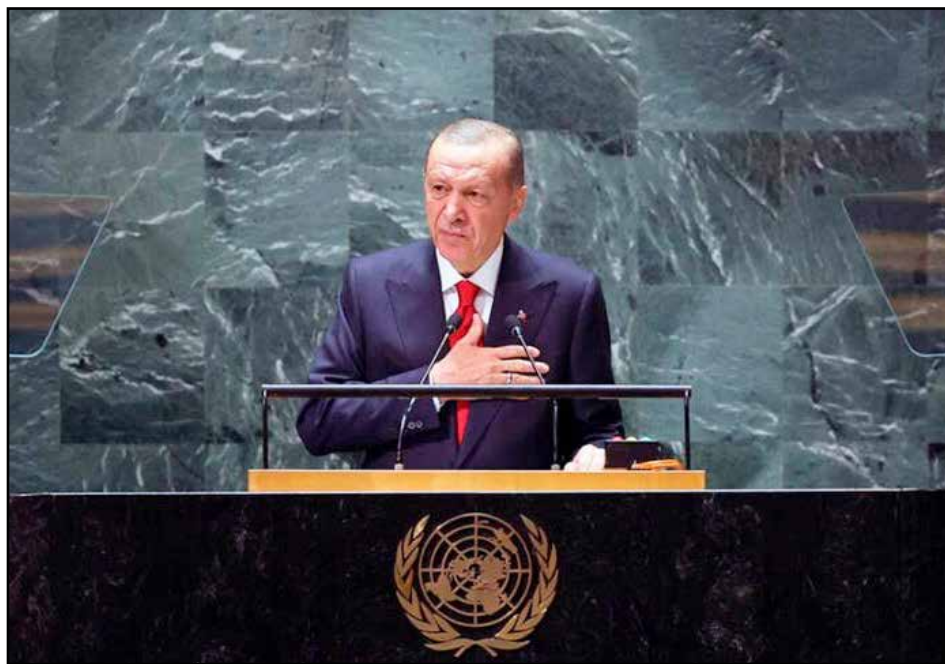
Ο Ρετζέπ Ταγίπ Ερντογάν μιλά στην 78 η Γενική Συνέλευση του ΟΗΕ στις 19 Σεπτεμβρίου 2023

Η Τουρκία προσπαθεί να ανταγωνιστεί το Ιράν. Διά του Ερντογάν διεκδικεί ρόλο στο μουσουλμανικό σουνιτικό κόσμο και ως διάδοχος της Οθωμανικής Αυτοκρατορίας στην Παλαιστίνη, ξεχνώντας ότι την πούλησε στους Σιωνιστές και τον Χερτζλ για να αντιμετωπίσει το δυσβάσταχτο χρέος της καταρρέουσας αυτοκρατορίας του ο σουλτάνος Αβδούλ Χαμίτ ο Β', ο οποίος εί-