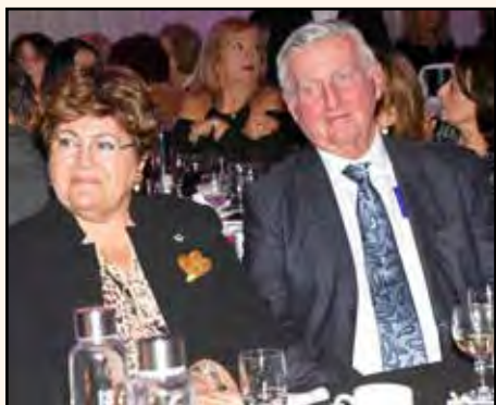
Η Μαίρη Ντέρου και ο πρώην δήμαρχος του Μόντρεαλ, Pierre Bourque

Τα τελευταία 15 χρόνια, το Εκπαιδευτικό Ίδρυμα Σωκράτης (SEF) έχει συγκεντρώσει χρήματα για να βοηθήσει τις οικογένειες που θέλουν να στείλουν τα παιδιά τους στα σχολεία Σωκράτης – Δημοσθένης αλλά δεν μπορούν να το κάνουν, λόγω οικονομικών περιορισμών. Περισσότερα από 500.000 δολάρια έχουν δοθεί, προκειμένου να παραμείνουν κατά μέσο όρο 25 μαθητές ετησίως εγγεγραμμένοι στα σχολεία Σωκράτης – Δημοσθένης.