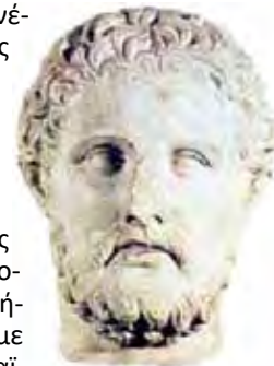
Μαρμάρινο κεφάλι του Αλκιβιάδη (Μουσείο Ny Karlsberg, Κοπεγχάγη). Η σύνθετη προσωπικότητα του Αθηναίου πολιτικού εκφράζεται στην προτομή αυτή.

Σπαρτιάτες. Στη συνέχεια οι επιχειρήσεις αναπτύσσονται στο Βόρειο Αιγαίο και στα στενά της Προποντίδας. Στα 405 π.Χ. ο Λύσανδρος στους Αιγός Ποταμούς, μία τοποθεσία στον Ελλησποντο, κυριεύει με τέχνασμα τα αθηναϊκά πλοία. Η καταστροφή των Αθηναίων ήταν ολοκληρωτική.