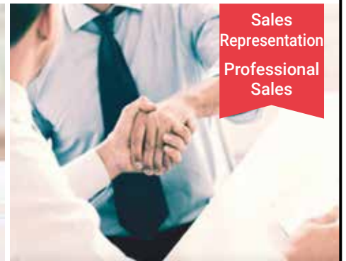
Sales Representation Professional Sales