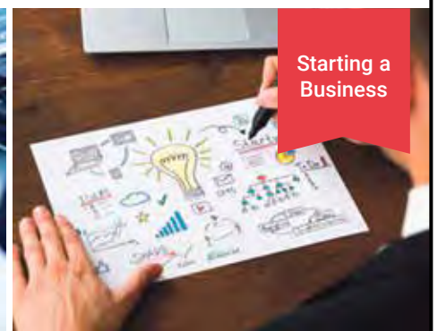
Starting a Business