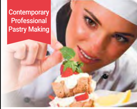
Contemporary Professional Pastry Making