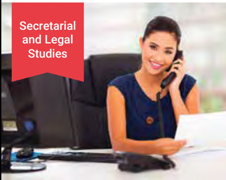
Secretarial and Legal Studies