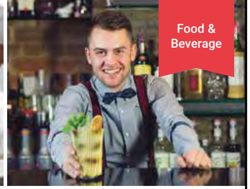
Food & Beverage